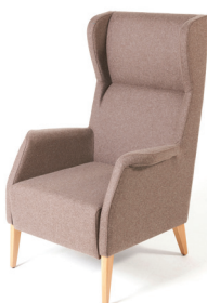
Luxor avec dossier haut